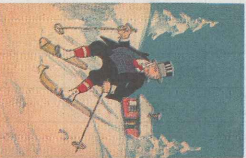
Finbeck kunne også brukes som julekortmotiv.