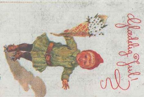
En av de mer anerkjente julekortkunstnerne var Jenny Nystrøm. Det finnes i dag mange samlere av hennes kort både i Norge og Sverige.