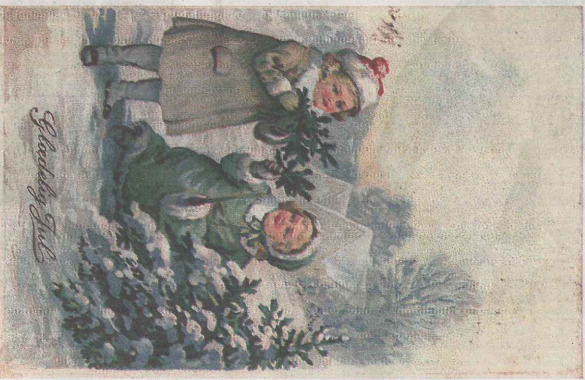
Granbar og kristtorn har alltid vært takknemlige deler av et julekortmotiv.