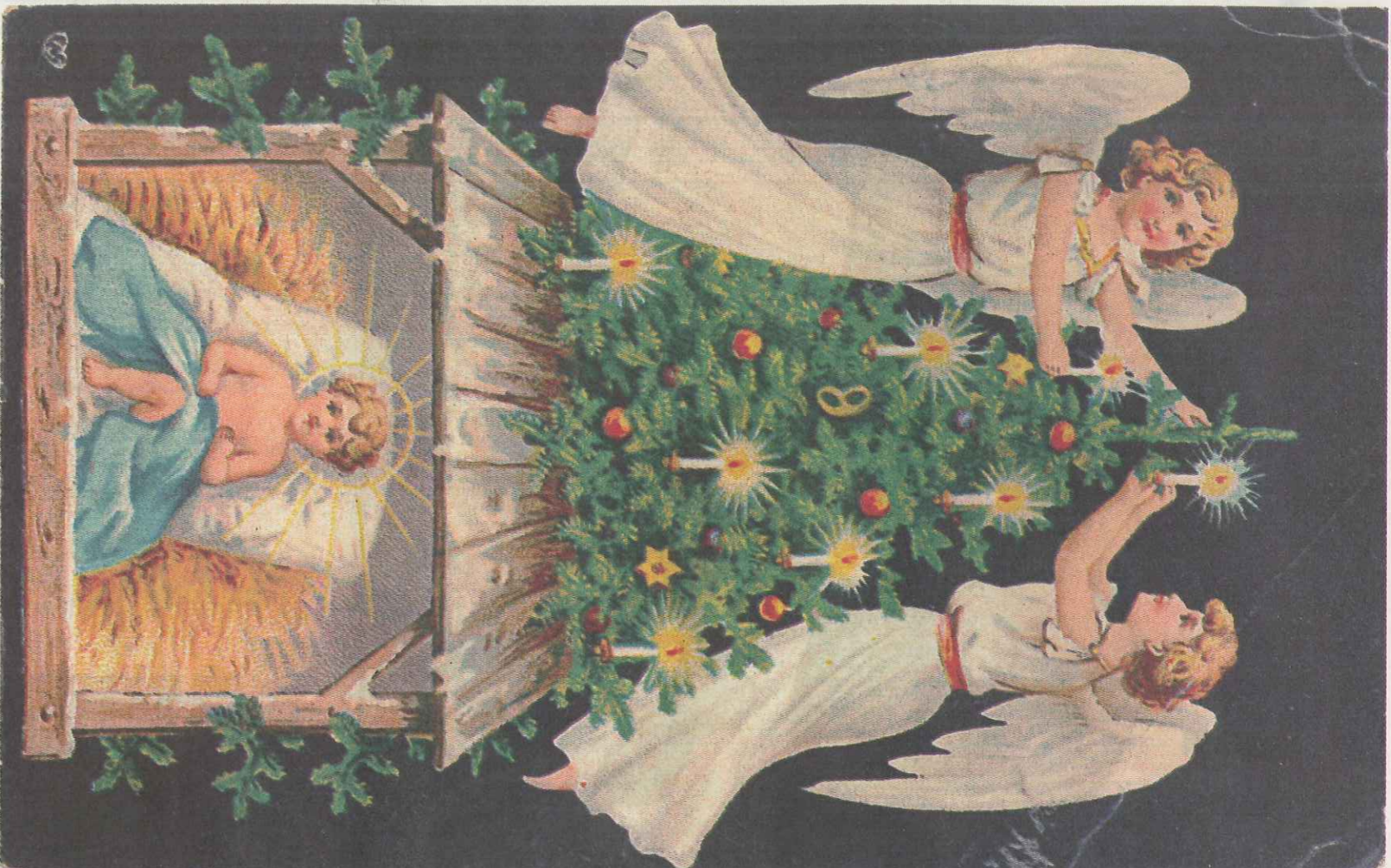
Trykkkvaliteten på de gamle julekortene var ofte meget god. Motivet var ofte, som i dag, Jesusbarnet og engler.