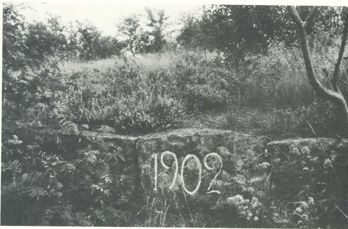
Et synlig minne fra unionstidens stridigheter og militære forberedelser.

Den som idag tar en tur opp på Mokollen, vil bli betatt av utsynet over et vakkert landskap, og glede seg over at vi bor i et naturskjønt og fritt land. Men forsvarsverkene der oppe skal minne oss om tider da det var ufred, og våre landsmenn var villige til å forsvare det landet vi har så kjært.